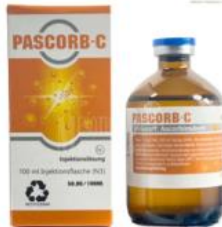
VITAMIN C 50%